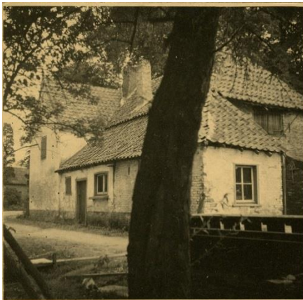
Houtzagerij annex woning aan de Rozendaalse Beek te Velp

Op een passagierslijst van het ss Edam II van de Nederlandsch Amerikaansche Stoomvaartmaatschappij, de voormalige Holland Amerikaanlijn vond ik alle namen van het gezin.